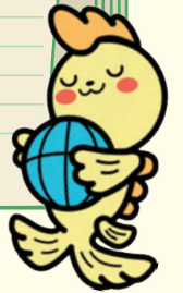
シャチのジュンちゃん